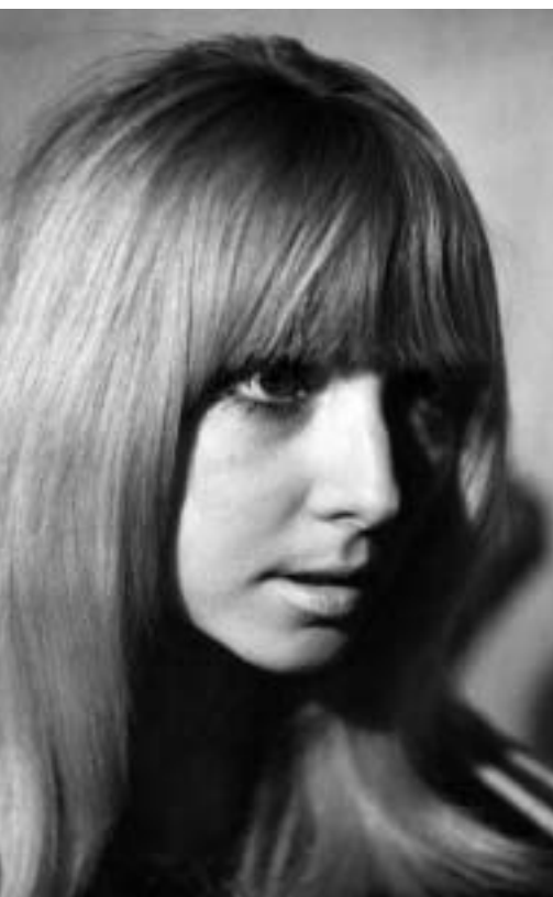
Maryla Rodowicz przed Ogólnopolskim Festiwalem Piosenki Studenckiej w Krakowie

W tym roku Maryla Rodowicz obchodzi Jubileusz 50-lecia pracy artystycznej. Jej początek dały występy w klubie studentów AWF – Relax.