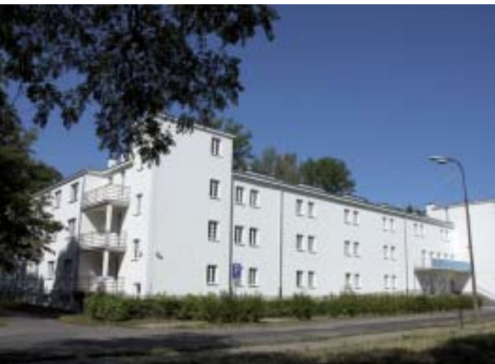
Odnowiony budynek Wydziału Rehabilitacji

Planujemy, i już prowadzimy, działania remontowe na dość szerokim froncie. Wśród nich znajdują się m.in.: zakończenie remontu hali lekkoatletycznej i remont dachu hali gier. Z pływalnią problem polega na tym, że poprzednie władze uczelni, kosztem wielu milionów złotych, przeprowadziły jej remont, ale nie do końca; „zapomniano” naprawić dach i węzeł ciepły. W najgorszym stanie jest budynek główny. Na dofinansowanie jego termomodernizacji