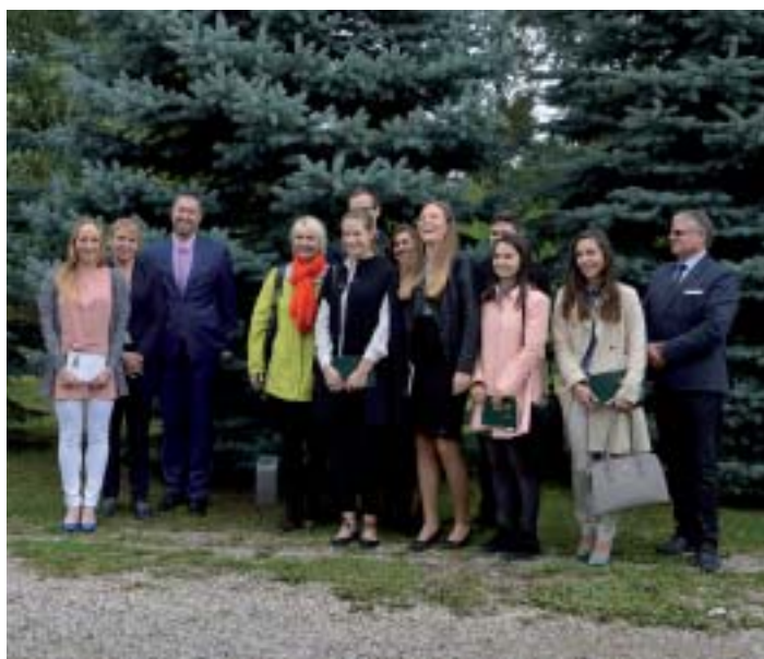
Kierownictwo Wydziału Rehabilitacji i absolwenci 2017 przy słupku